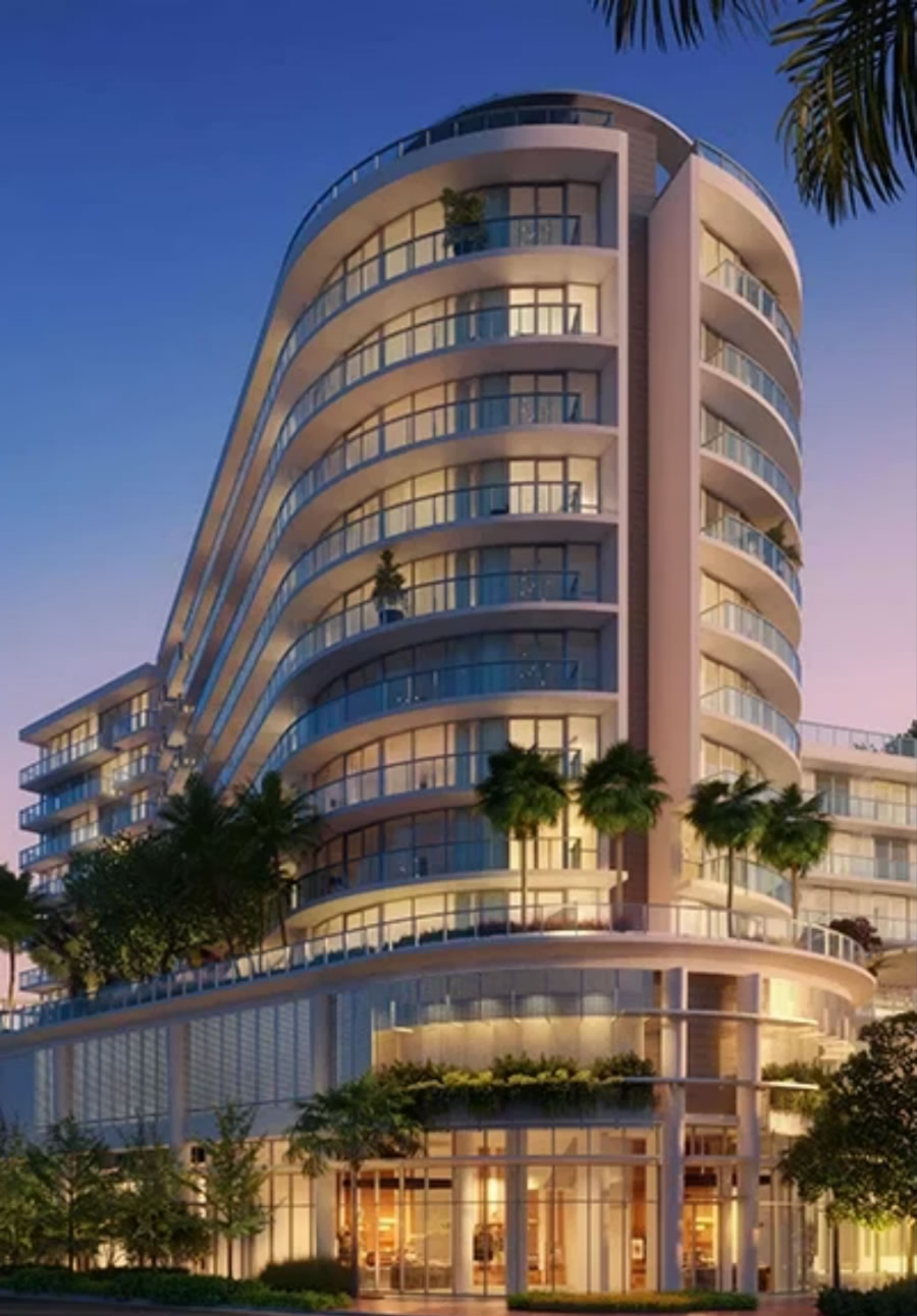
ARTIST CONCEPTUAL RENDERING